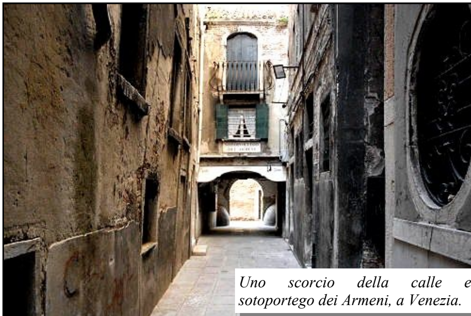
Uno scorcio della calle e sottoportego dei Armeni, a Venezia.

S. Zulian non era l'unica zona ad alta concentrazione armena di Venezia. Nel 1530 cominciano a giungere diverse famiglie armene provenienti da Giulfra, città sotto la sovranità persiana, sulla riva settentrionale del fiume Araxe, nel Nakhitchevan meridionale. Questi nuclei si concentrano