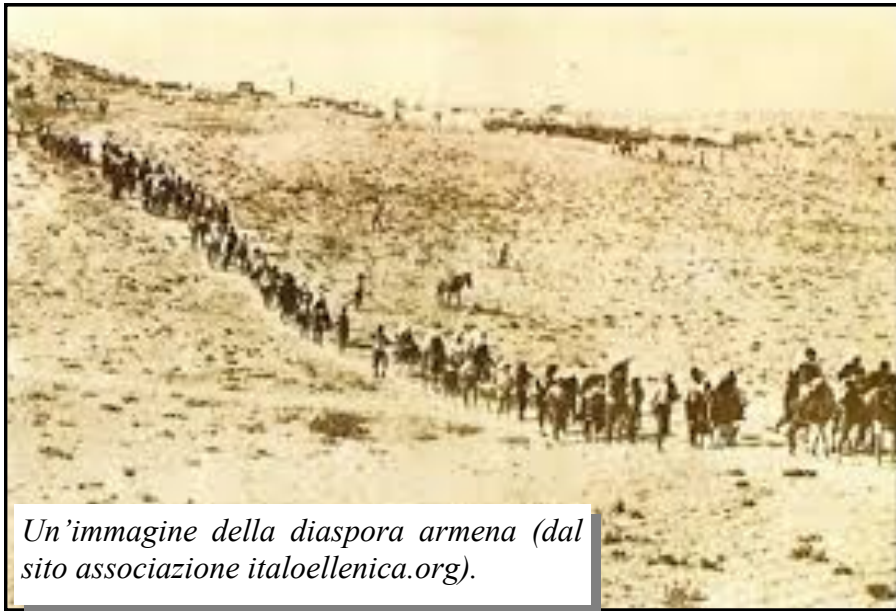
Un'immagine della diaspora armena.

vittime innocenti, ma soprattutto cercheremo di esercitare la memoria nel senso più alto diffondendo la cultura armena per come essa ha saputo esprimersi in Italia e nel mondo con i suoi tanti figli allontanati dalla terra d'origine. Per gli armeni, lo sforzo per l'integrazione armoniosa nelle società ospitanti è stata una carta vincente per la loro sopravvivenza. Bisogna valutare e valorizzare, come un buon esempio, le dinamiche con cui una minoranza di stranieri ha interagito in modo positivo con la società ospite senza perdere le proprie originalità costitutive.