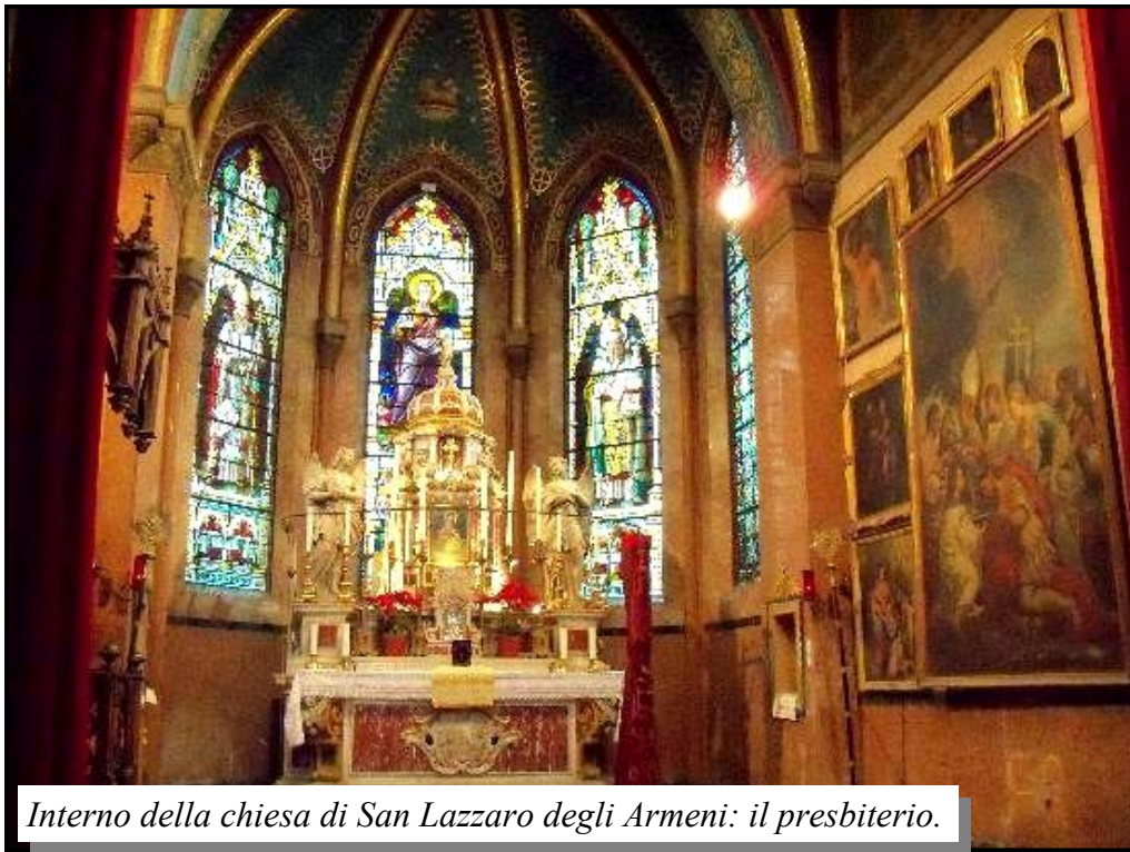
Interno della chiesa di San Lazzaro degli Armeni: il presbiterio.

l'Armenia e il Veneto, raccoglie una serie di testimonianze/interviste tra gli armeni che vivono nel Veneto, e molti tra questi sono stati proprio allievi del prestigioso Moorat-Raphael. Da studioso, e non solo da ex-allievo, egli non esita a definire il Collegio "perla della propagazione della cultura armena di Venezia, attraverso l'opera dei suoi alunni e dei suoi insegnanti. [...] Faro di scienza, ma soprattutto di amenità."