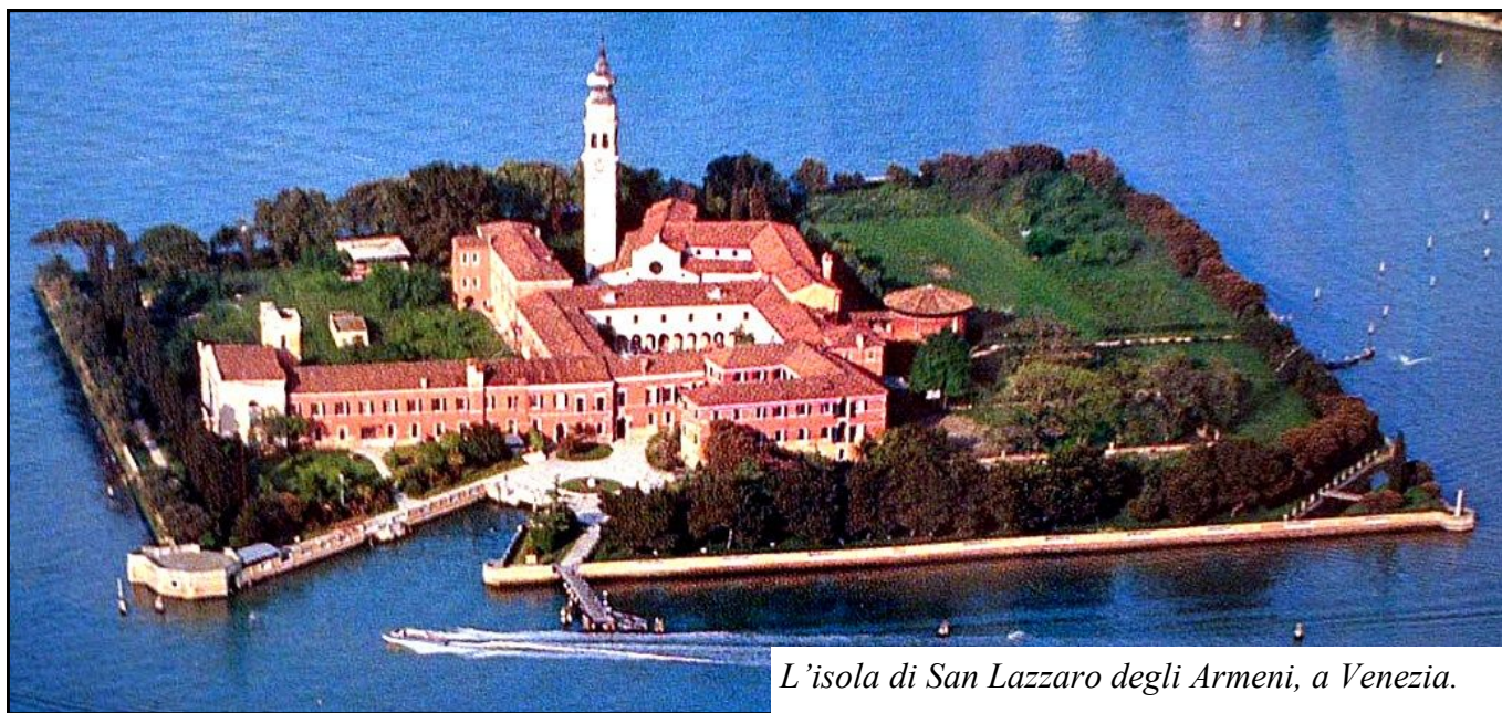
L'isola di San Lazzaro degli Armeni, a Venezia.