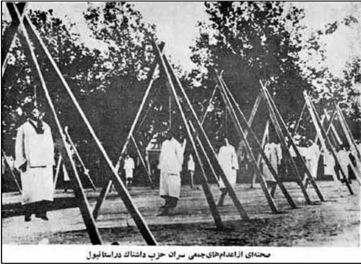
Qui sopra: Armeni impiccati ad Aleppo nel 1915.