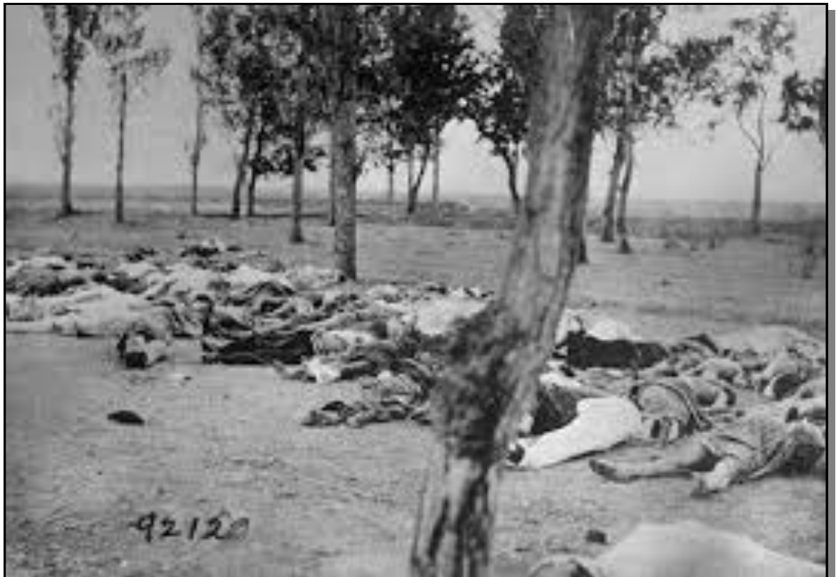
Sotto: un'altra immagine della strage perpetrata dai Turchi nei confronti del popolo Armeno (dal sito freeforumzone.leonardo.it).