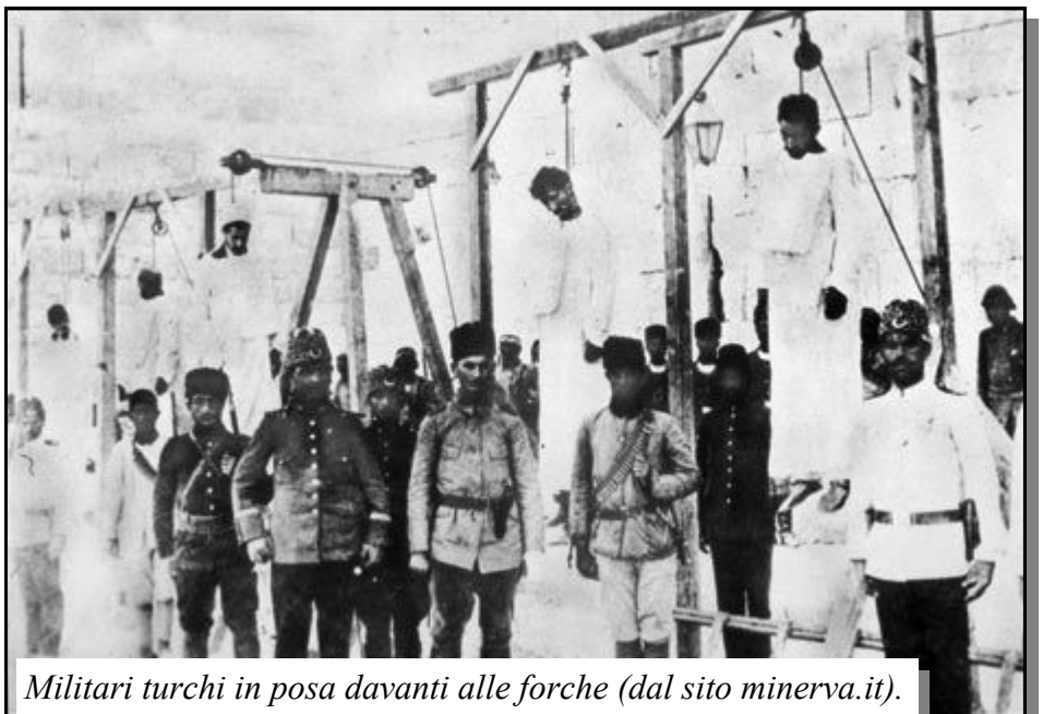
Militari turchi in posa davanti alle forche.