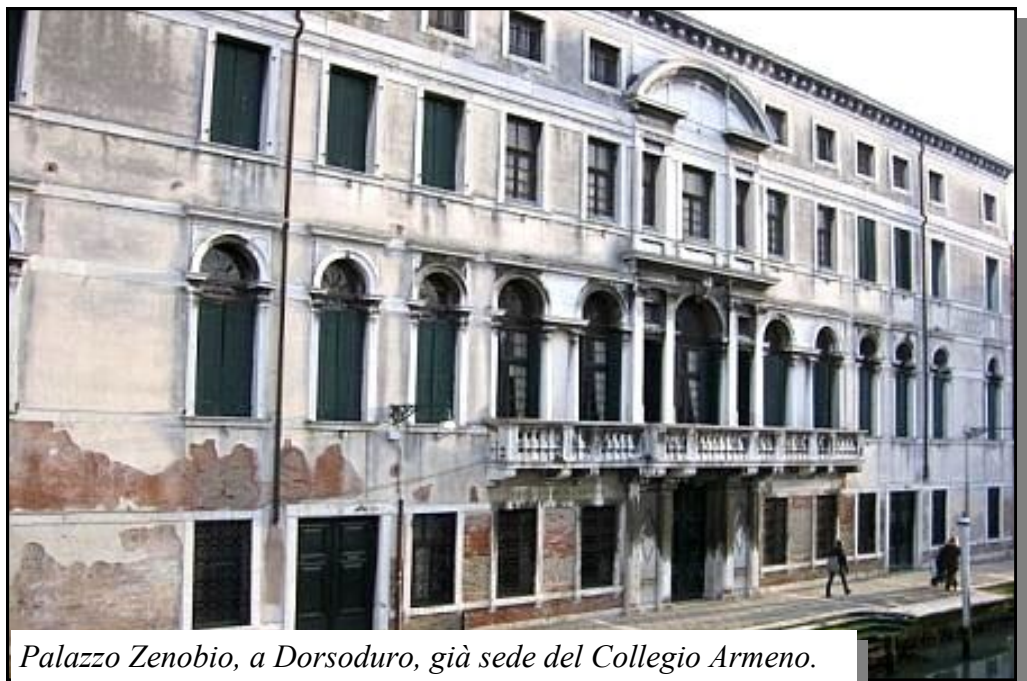
Palazzo Zenobio, a Dorsoduro, già sede del Collegio Armeno.

Sono in molti, tra gli ex-allievi del collegio mechtarista Moorat-Raphael di Venezia ad essersi fermati, negli ultimi decenni, definitivamente in Italia. Provenienti dal Libano, dall'Iran, dalla Siria, da Istanbul o da altri centri diasporici, hanno poi