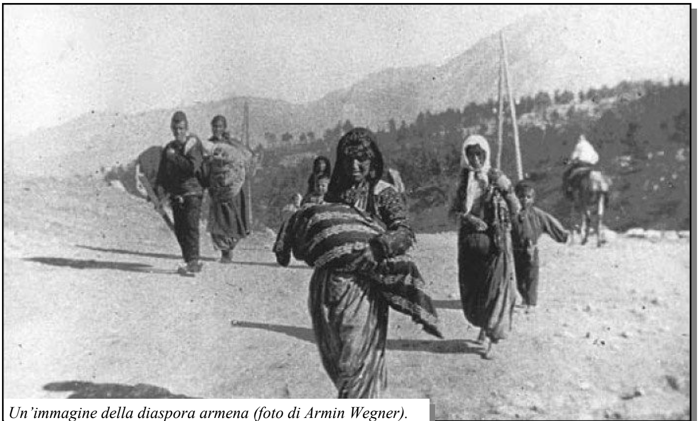
Un'immagine della diaspora armena.

Al secolo XVI risale la prima forte spinta al risorgere della