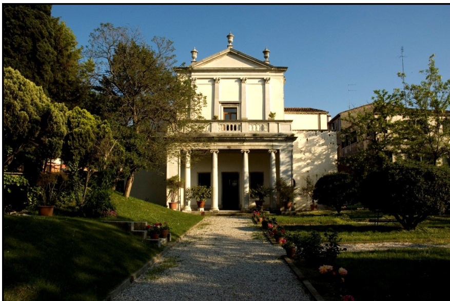
Biblioteca Zenobiana del Temanza, a Venezia.

ne della Cultura Armena di Venezia, fondato a Milano negli anni '60 per poi trasferirsi a Venezia nel 1991, presso la Biblioteca Zenobiana del Temanza, dove ospita buona parte delle proprie attività accademiche, culturali, editoriali, musicali e discografiche, con una biblioteca specializzata aperta al pubblico, rappresenta una delle rare istituzioni armenie della Diaspora che si sono viste riconosciute, per un'apposita norma di qualche anno fa, con un sostegno diretto delle massime istituzioni statali della Repubblica d'Armenia.